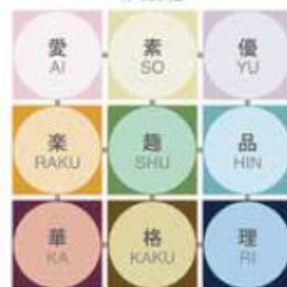
Classification of image into 9 categories

プロフィール／ 北海道札幌市生まれ。 武蔵野美術大学基礎デザイン学科卒業後、株式会社日本カラーデザイン研究所、札幌市高等専門学校教授を経て、2005年より静岡文化芸術大学副学長を歴任。2014年に静岡文化芸術大学を退職。現在、株式会社デザインインテグレート代表取締役、静岡文化芸術大学名誉教授。 色彩とイメージを軸として、ファッション、住宅、家具、インテリア、家電や自動車などの工業製品、食品パッケージ、店舗、色彩・イメージ分析ソフトなどの開発、商品開発、販売促進や広告宣伝、CI計画、企業戦略、及び景観ガイドラインの策定、人材教育、能力開発などの幅広い分野をフィールドとする。